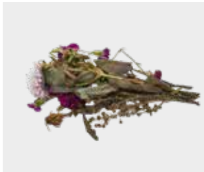
گل، برگ و علف هرز