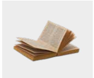
کتاب‌های دارای جلد نازک (یا اهدایی به خیریه)