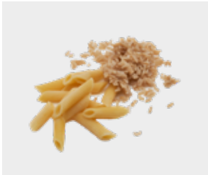
برنج و پاستا