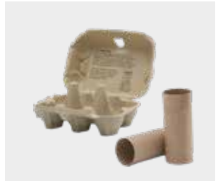
جعبه تخم‌مرغ و لوله‌های رول دستمال توالت