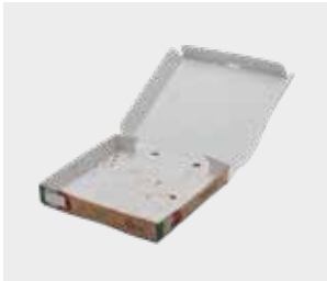
جعبه تمیز پیتزا