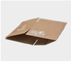
جعبه‌های مقوایی استفاده کنید