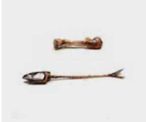
گوشت قرمز، ماهی و استخوان

* برای جمع‌آوری زباله باغچه داشتن مجوز لازم است – آنلاین تقاضا دهید