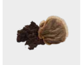
چای کیسه‌ای و تفاله‌های قهوه