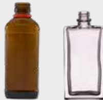
قوطی دارو و عطر استفاده کنید