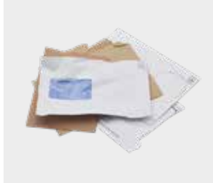
پاکت نامه و آگهی‌های پستی