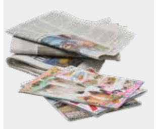
روزنامه و مجلات