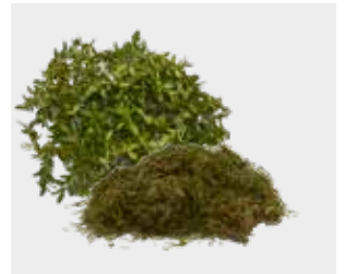
چمن و پرچین هرس شده