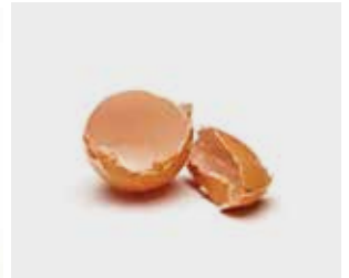
تخم مرغ و پوست تخم مرغ