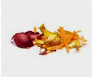
میوه، سبزیجات و پوست میوه