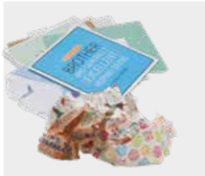
کارت‌های تبریک و کاغذ کادو