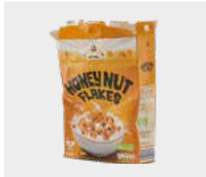
پاکت غلات و غلاف ظرف غذا