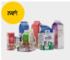
ਭੋਜਨ ਅਤੇ ਪੀਣ ਵਾਲੇ ਡੱਬੇ