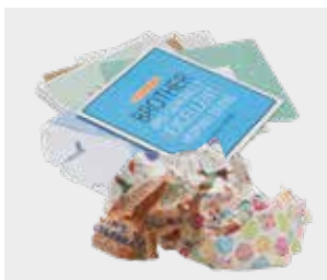
ਗ੍ਰੀਟਿੰਗ ਕਾਰਡ ਅਤੇ ਰੈਪਿੰਗ ਪੇਪਰ