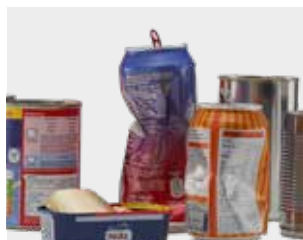
ਟਿਨ ਅਤੇ ਕੈਨ