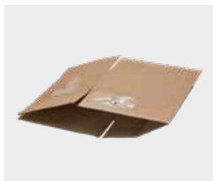
ਗੱਤੇ ਦੇ ਡੱਬੇ