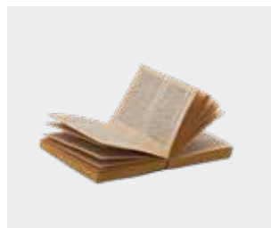
ਪੇਪਰਬੈਕ ਕਾਰਡ (ਜਾਂ ਚੈਰਿਟੀ ਨੂੰ ਦਾਨ ਕਰੋ)