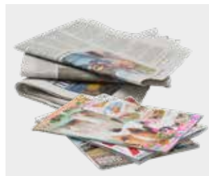
ਅਖਬਾਰ ਅਤੇ ਰਸਾਲੇ