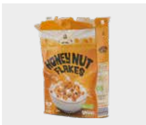
ਸੀਰੀਅਲ ਵਾਲੇ ਡੱਬੇ ਅਤੇ ਭੋਜਨ ਉਤਲੀਆਂ ਸਲੀਵਾਂ