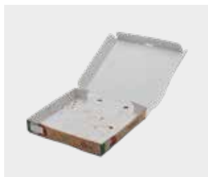
ਪੀਜ਼ਾ ਵਾਲੇ ਸਾਫ਼ ਬਾਕਸ