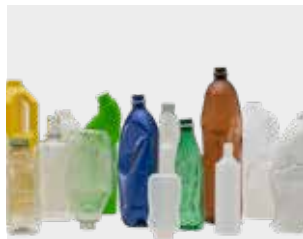
ਪਲਾਸਟਿਕ ਦੀਆਂ ਬੋਤਲਾਂ