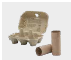
ਅੰਡਿਆਂ ਦੇ ਡੱਬੇ ਅਤੇ ਟਾਇਲਟ ਰੋਲ ਟਿਊਬਾਂ