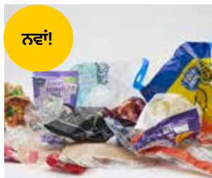
ਨਰਮ ਪਲਾਸਟਿਕ ਅਤੇ ਫਿਲਮ (ਉਦਾਹਰਨ ਲਈ ਪਲਾਸਟਿਕ ਰੈਪਿੰਗ, ਕੈਰੀਅਰ ਬੈਗ, ਫਿਲਮ ਢੱਕਣ)