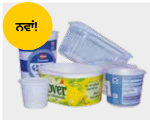
ਪਲਾਸਟਿਕ ਦੇ ਡੱਬੇ, ਟੱਬ ਅਤੇ ਟ੍ਰੇ - ਨਵਾਂ!