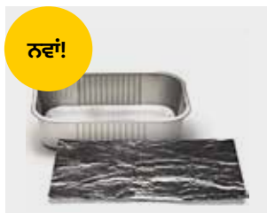
ਸਾਫ਼ ਅਲੂਮੀਨੀਅਮ ਫੋਇਲ ਅਤੇ ਫੋਇਲ ਟ੍ਰੇ