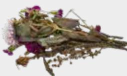
ਫੁੱਲ, ਪੱਤੇ ਅਤੇ ਨਦੀਨ