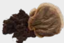
ਚਾਹ ਦੇ ਬੈਗ ਅਤੇ ਕੁੱਟੀ ਹੋਈ ਕੌਫੀ