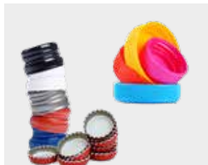
ਪਲਾਸਟਿਕ ਅਤੇ ਧਾਤੂ ਦੇ ਢੱਕਣ ਅਤੇ ਕਵਰ