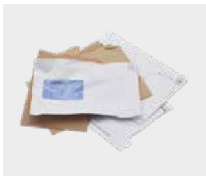
ਲਿਫਾਫੇ ਅਤੇ ਫਾਲਤੂ ਡਾਕ