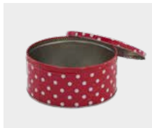
ਧਾਤ ਅਤੇ ਪਲਾਸਟਿਕ ਦੇ ਟਾਫੀਆਂ ਅਤੇ ਬਿਸਕੁਟ ਵਾਲੇ ਟਿੰਨ