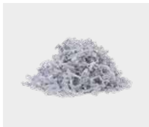
ਕਤਰਿਆ ਹੋਇਆ ਕਾਗਜ਼