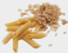
ਚਾਵਲ ਅਤੇ ਪਾਸਤਾ